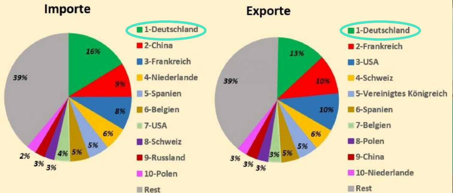
Italien: 2020 Importe und Exporte - % Anteil der Top 10 Länder